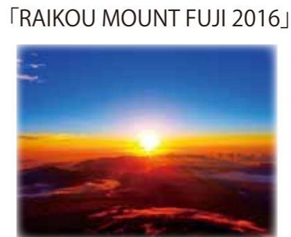
「RAIKOU MOUNT FUJI 2016」 【自然部門】