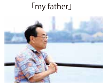
「my father」 【家族部門】