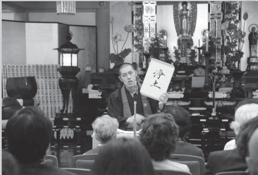
平成23年度、十夜法話の様子。