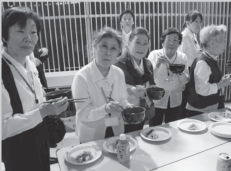
今年も熱々の芋煮を用意しております。