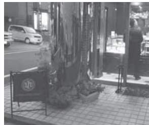
▲入口の立て看板が目印