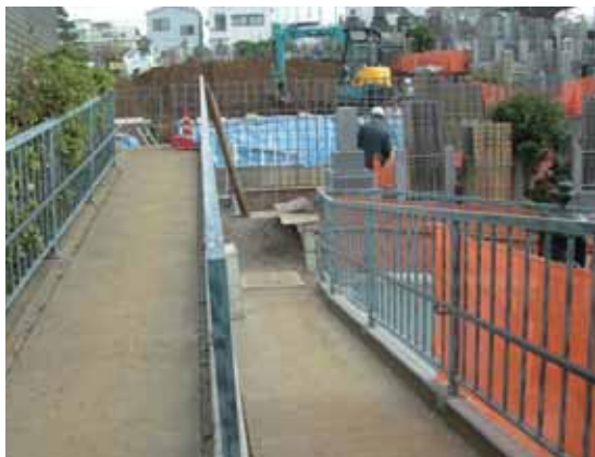
現在改修工事中の車いす用スロープ。