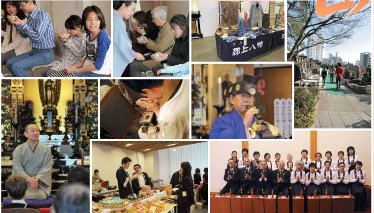
平成22年 春彼岸風景