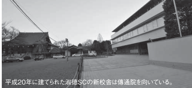
平成20年に建てられた淑徳SCの新校舎は傳通院を向いている。

今回は合同の団体参拝旅行を企画実践している傳通院 かんすう の貫主、そしてその境内にある淑徳学園の理事長でもある上人にお話を伺った。学校教育の在り方がよく話題にのぼる中、新たな学問の場を作ろうと大きな改革に乗り出された理事長として、その想いをお聞かせいただいた。