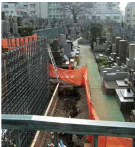
工事完成後車いすでのお参りが可能となる墓地列。