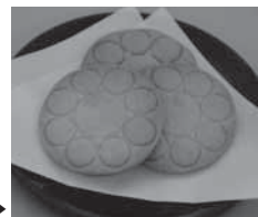
法要お茶菓子のクッキー▶

ンテ イタリア本店」などでのパティシエを経験。二〇〇六年に自身のブランド「ISOO」を立ち上げられました。店内に並ぶケーキや焼き菓子はどれも優しい甘さで、素朴な味わい。その美味しさの評判を聞きつけて求めにくるお客さんも多いそう。皆さんも法要の際はぜひお召し上がりください。