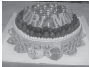
▲オーダーケーキはご予算に合わせて

営業時間／11:00～20:00 定休日／日曜日 住所／東京都港区六本木7-21-8-101 TEL・FAX／03-3403-6711